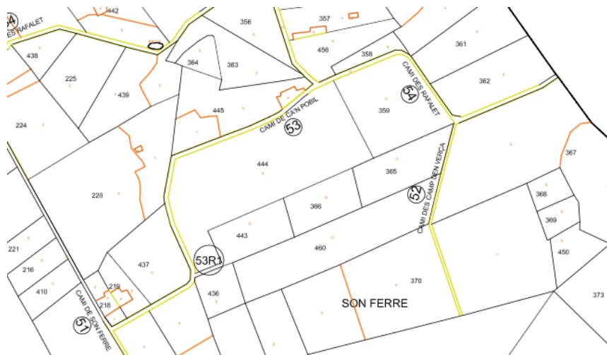
Trazado propuesto Camino Ca'n Pòbil